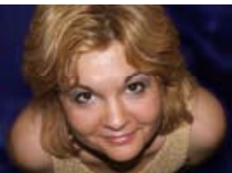
Diana IEPURE - poet (n. 1970, Chișinău, Republica Moldova)