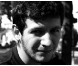
Vladimir US - artist plastic, curator (n. 1980, Chișinău, Republica Moldova)