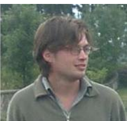
Vadim VASILIU – poet, traducător (n. 1985, Chișinău, Republica Moldova)